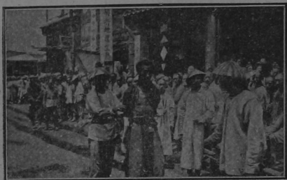
Un rebelde al ser presentado al Tribunal, antes de su ejecución

Cada momento que pasa es más apremiante para el trono Los horrores de la revolución en China