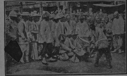
Decapitación de un revolucionario en una plaza pública

A 60 cénts. libra Puede Ud. conseguir en «EL GALLITO» chocolate dulce en tabletas de ¼ de libra