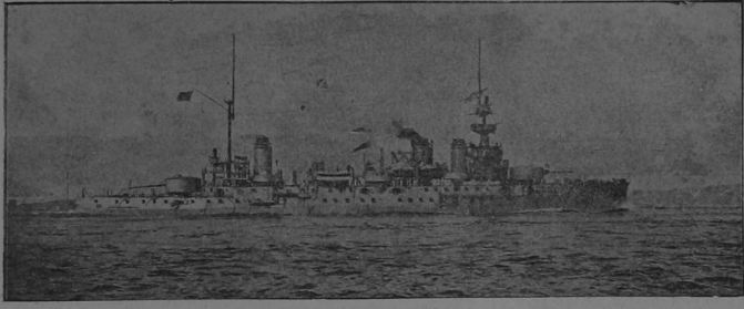
El acorazado francés «Liberté»

La explosión del «Liberté» se produjo á causa de un incendio, contra el cual luchó heroicamente la tri-