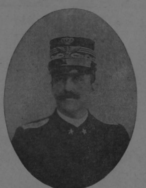
S. M. Vittorio Emanuele III

Dentro de su hogar, el primer hogar de Italia, disfruta del dulce afecto de su bella esposa, la Reina Elena de Montenegro y pasa las horas de descanso con sus encantadoras hijas el Príncipe Humberto y las princesas Jolanda, Mafalda y Giovanna, los niños, los educos y los preparara infundidos en su bondad ya energía. Eso como padre: como Rey ha procurado por todos los medios engrandecer su